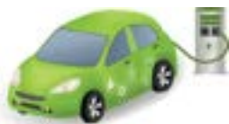
Vehículos eléctricos seminario web | pags. 4