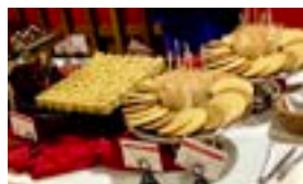
Miembro de la UWRA Recepción | pags. 2