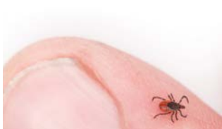
蜱蟲季節 | p. 8個