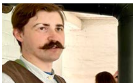
參觀舊世界 威斯康星 | p. 4個