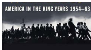
書評：離別的 沃特世 | p. 11