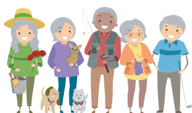
Instituto sobre el Envejecimiento Coloquio | pag. 2